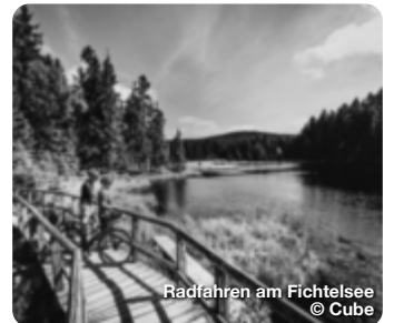
Radfahren am Fichtelsee

Westlich von Bayreuth gelegen, bietet Eckersdorf ein Wanderwegenetz von über 100 km, das Sie schnell ins Herz der Fränkischen Schweiz mit ihrer herrlichen Landschaft führt. TreffpunktDeutschland.de/eckersdorf