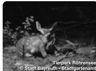
Tierpark Röhrensee

International bekannt ist die oberfränkische Stadt Bayreuth durch die Wagner-Festspiele. Sicher nicht das einzige Highlight, das die Herzen der Opernfreunde höher schlagen lässt. TreffpunktDeutschland.de/bayreuth