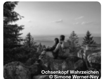
Ochsenkopf Wahrzeichen

Das Museum in Plech gehört mit über 250 Quadratmetern Ausstellungsfläche heute schon zu den bedeutendsten Foto-Museen Europas. Über 30.000 Sammlungstücke, darunter 9.000 Fotoapparate wurden zusammengetragen. (November bis Februar geschlossen.) Schulstr. 8, Plech