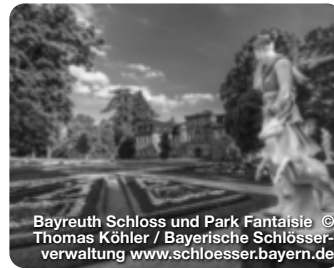
Bayreuth Schloss und Park Fantaisie

Genießen Sie ungeahnte Aussichten und Einblicke schon während der gut 700 m langen Bergauffahrt bevor Sie sich in die über 1.000 m lange, überaus abwechslungsreiche Abfahrt stürzen. Freibershammer 27, Bischofsgrün