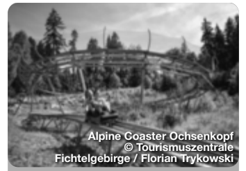
Alpine Coaster Ochsenkopf

Parkanlage im Süden Bayreuths begeistert alle Generationen. Mit Tieren wie Kängurus und Flamingos, botanischen Besonderheiten und großem Spielplatz am See. Pottensteiner Str., Bayreuth