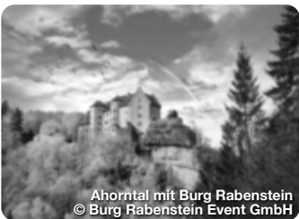
Ahorntal mit Burg Rabenstein