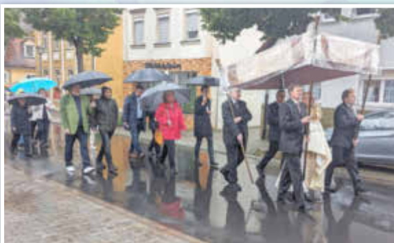
Der Himmel öffnete seine Schleusen, unter dem Fronleichnam-Himmel blieb es trocken.