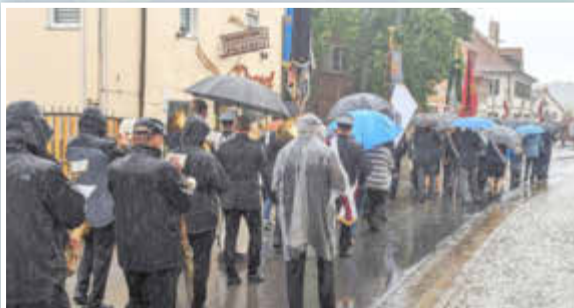
Ein Meer von Regenschirmen auf der Bundesstraße ...