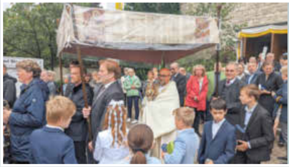
Bei der Prozessions-Aufstellung herrschte (noch) Optimismus und die Regenschirme blieben (noch) zu.