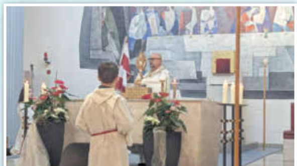
Der eucharistische Segen in der Pfarrkirche.