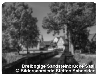
Dreibogige Sandsteinbrücke Saal