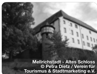
Mellrichstadt - Altes Schloss

Der Landkreis Rhön-Grabfeld liegt im Herzen Deutschlands und ist bekannt für seine atemberaubende Natur. Die Region ist geprägt von Bergen, Tälern, Flüssen, Seen und Wäldern. Mehr als 50 % des UNESCO-Biosphärenreservats Rhön befinden sich im Landkreis Rhön-Grabfeld. Hier wird die Natur mit ihren vielen, teilweise selten gewordenen Tieren und Pflanzen geschützt und bewahrt. Gleichzeitig bietet die einmalige Natur- und Kulturlandschaft viele Bildungs- und Erlebnisangebote für Besucherinnen und Besucher. Ein Beispiel für Schutz, Erlebnis und Bildung zugleich ist das Schwarze Moor auf der Langend Rhön, welches zu den bedeutendsten Hochmooren Europas zählt. Mit solchen Besonderheiten und derzeit 243 Wandertouren ist die Region ein Paradies für Wanderbegeisterte. TreffpunktDeutschland.de/rhoen-grabfeld