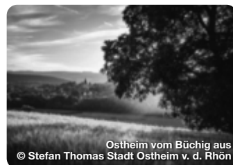
Ostheim vom Büchig aus © Stefan Thomas Stadt Ostheim v. d. Rhön