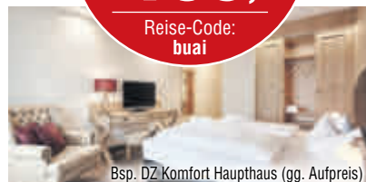
Bsp. DZ Komfort Haupthaus (gg. Aufpreis)