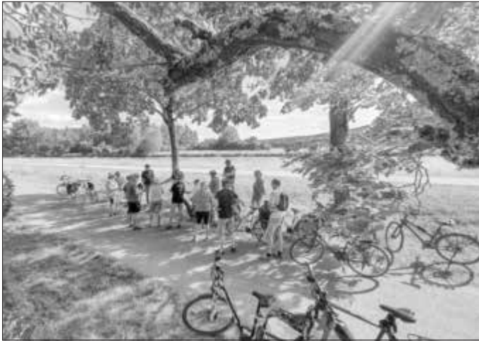
An der Rentnerruh am Main-Donau-Kanal zwischen Strullendorf und Bamberg