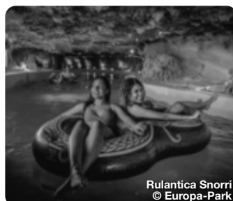
Rulantica Snorri