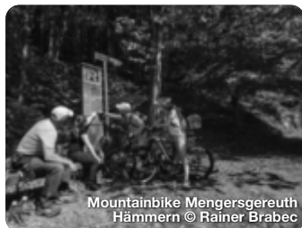
Mountainbike Mengersgereuth Hämmern

Alle Termine und Angaben unter Vorbehalt!